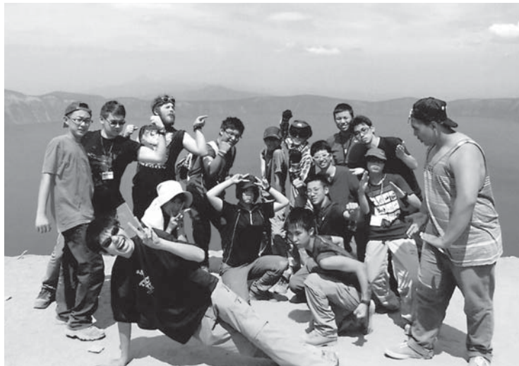
僕と仲間と毎日自然!!