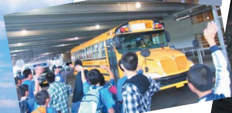
アンバサダーを乗せたバス到着