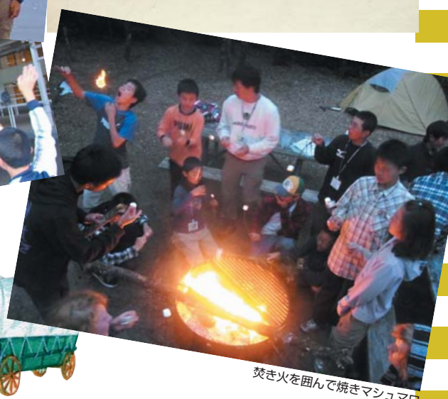
焚き火を囲んで焼きマッシュマロ