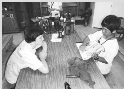
準備してきたアルバムでしっかり交流！事前活動で準備してきた日本文化を紹介するチャンスは、自分で積極的に作っていきます！