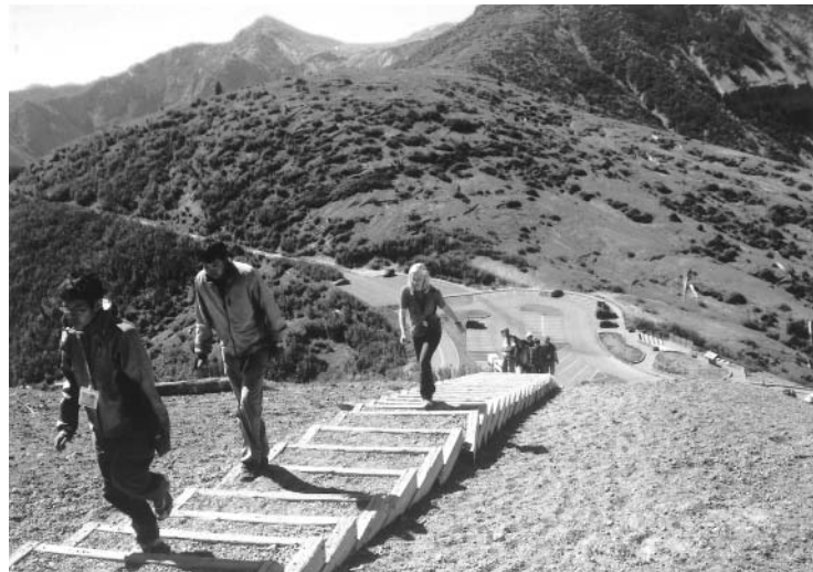
有名な火山、セント・ヘレンズに到着。火山の頂辺を目指していざ出発！

私は、ハイクをしたり川で遊んだりして、オレゴンの自然にたくさんふれることができました。ハイクで色々な所を歩いて、たくさんの植物や動物を見て、色々なことを学びました。