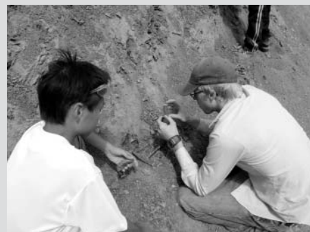
化石の発掘にチャレンジ！どんな発見があったのかな？