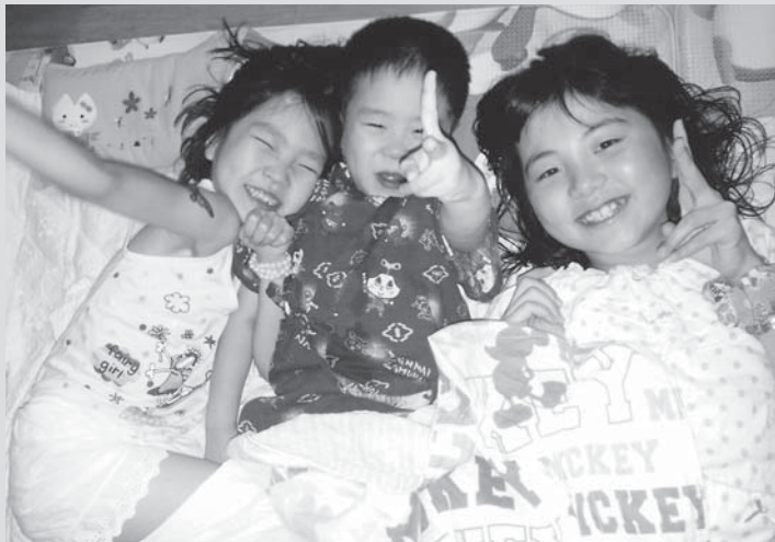
すぐになかよくなった。ねるときもいっしょ。

ホストは最終日に私を抱きしめて「また来てね」と言ってくれました。この家族に出会ってたくさんの思い出が出来ました。私を受け入れてくれて、ホストファミリーには心から感謝しています。日本に帰って自分の家族に会ったときに、この体験をさせてくれたこと、自分の味方でいてくれたことを感謝してこれから生活したいです。