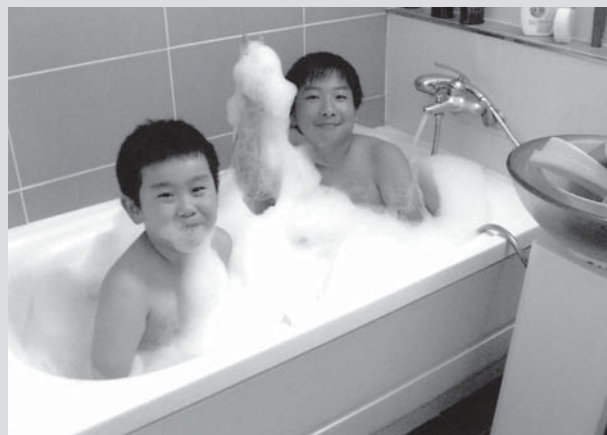
泡風呂で水鉄砲。楽しかったね。