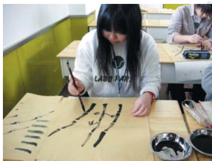
上海での授業風景。水墨画にチャレンジしました。

悠久の歴史と躍進する現代がおりなす中国は多様で豊かな文化をもつ国です。2008年の北京五輪以降、毎年国際的なイベントが開催されるなど、各地で超近代的な建設が進む一方、伝統文化も根強く残っています。受入れ団体である北京月壇中学と上海外国学校では、日本語を学んでいる学生がみなさんのホストです。近くて遠い国、中国にはみなさんの知らない新しい価値観、文化、習慣、そして思いがけない出会いや発見が待っています。