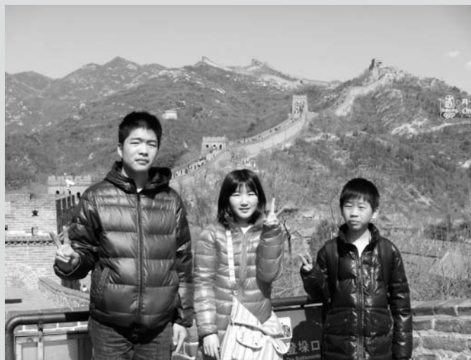
快晴の空の下、ホストと一緒に記念撮影。