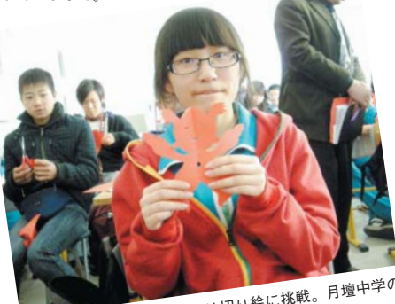
北京での授業風景。北京では切り絵に挑戦。月壇中学の生徒さんによる完成見本です。