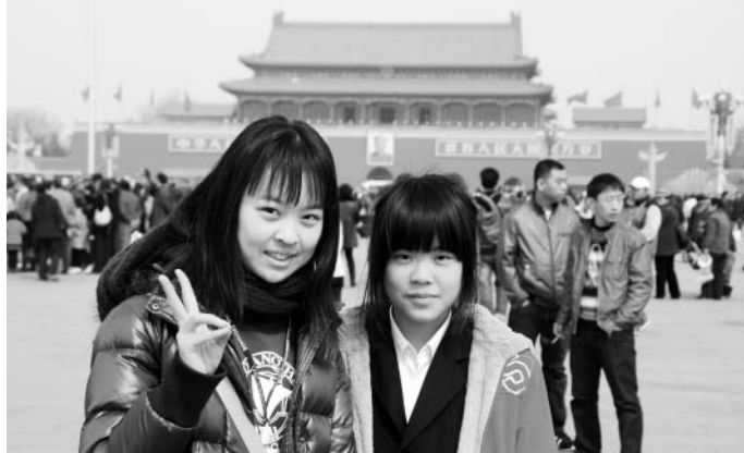
ホストと記念撮影！北京の人民広場は、いつも大賑わいです。