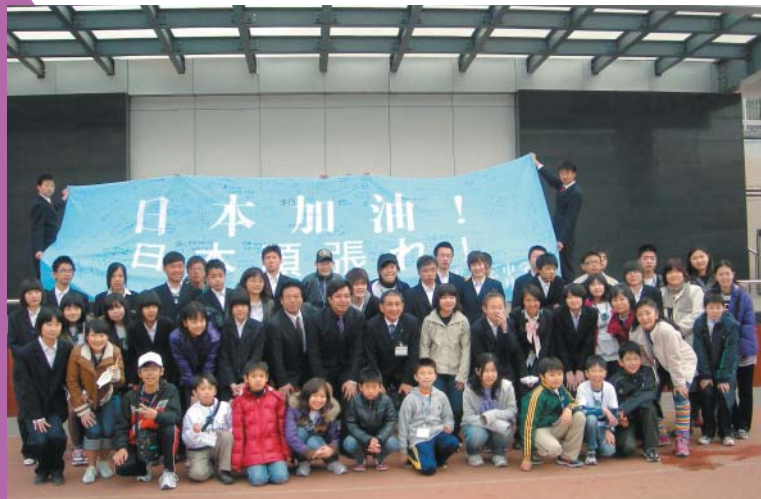
東日本大震災後、間もなくの訪中となった第26回ラボ・中国青少年交流。北京での対面時、「日本加油！日本頑張れ！」の横断幕が北京市月壇中学より寄贈されました。横断幕は、北京の皆さんからのたくさんの励ましのメッセージで埋め尽くされていました。